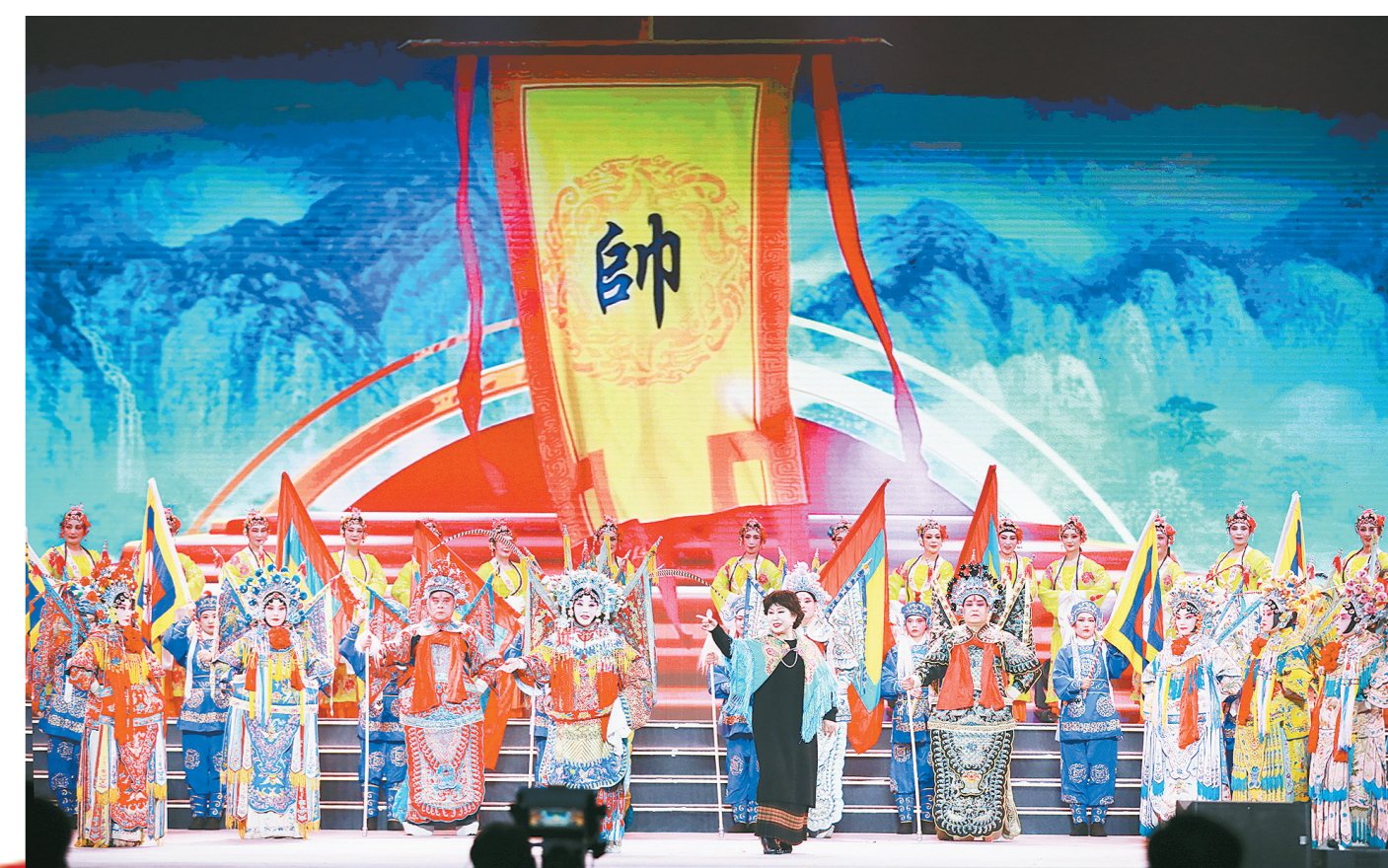
豫剧《三上皇 鼓乐五鼓鸣叫》