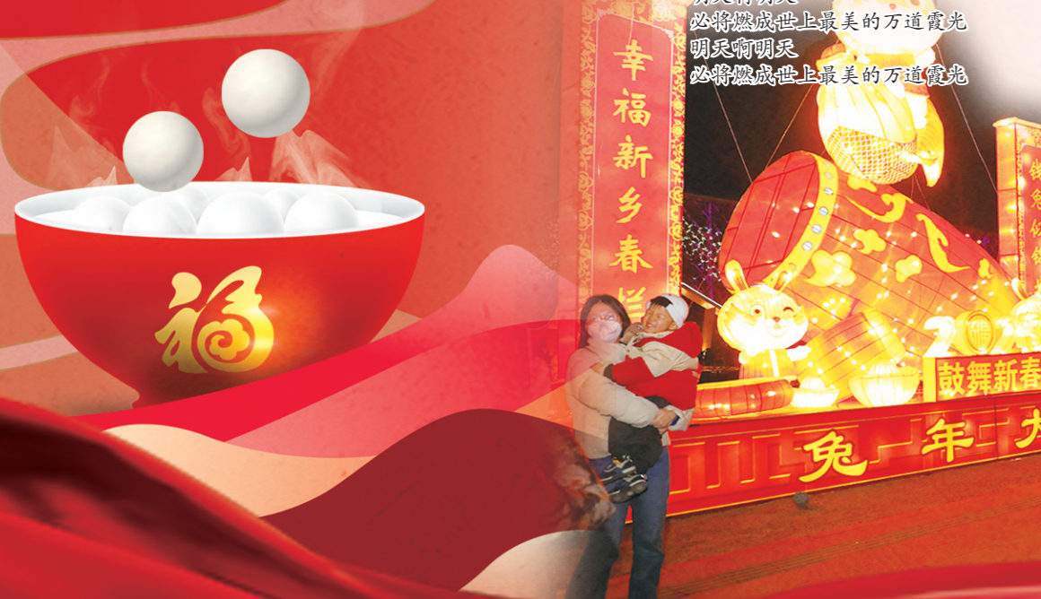
市民来到新乡青年体育中心元宵灯展现场观赏元宵灯展,尽情享受节日欢乐