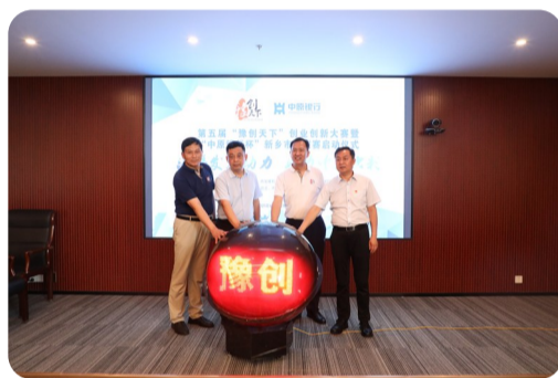
承办第五届“豫创天下”创业创新大赛

虎虎生威开新局,“中原”何处不春风。中原银行新乡分行将以强烈的使命感、负重感、责任感,以“中原”气势,出金融新彩,喜迎新乡“两会”的召开。