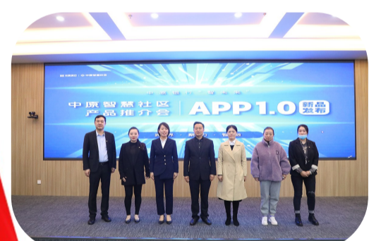
中原银行新乡分行举行“中原智慧社区1.0”产品发布会

人居环境整治提供数字化管理工具。截至目前,全市已注册乡村在线11.77万户,涵盖164个乡镇,3304个村庄社区,创新了基层治理模式,有效提升了基层群众参与度。草摇叶响知鹿过,松风一起知虎来。发展的画卷,在砥砺前行中铺展,春天的乐章,在奋力奔跑中奏响。2022年,中原银行新乡分行将持续深入贯彻市委市政府各项决策部署,聚焦主责主业,强化责任担当,严控风险,合规经营,以实际行动迎接党的二十大胜利召开,以更加昂扬的奋斗姿态,携手开创更加美好的发展未来。