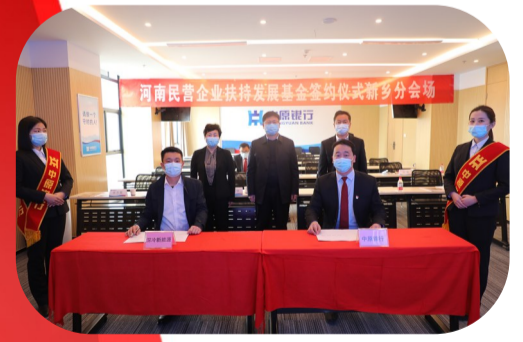
中原银行新乡分行参加企业扶持发展基金签约仪式