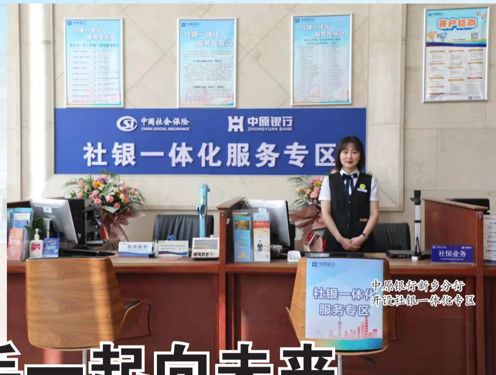
中原银行新乡分行 开设社银一体化专区