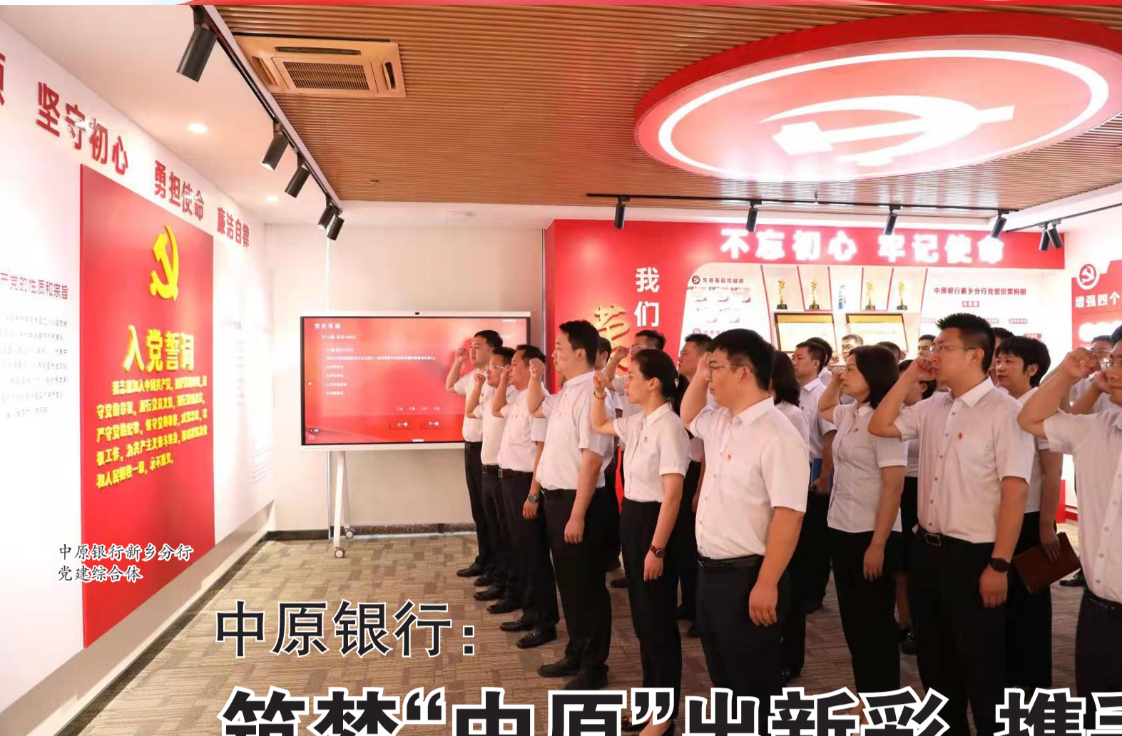
中原银行新乡分行 党建综合体验馆