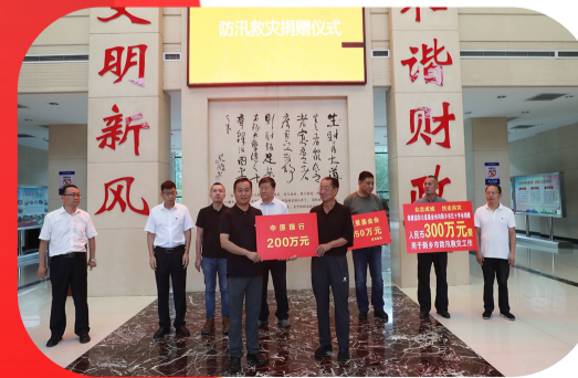
中原银行为抗洪救灾捐赠200万元