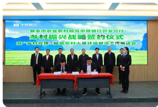
中原银行新乡分行与新乡市农业农村局 签订乡村振兴战略合作协议